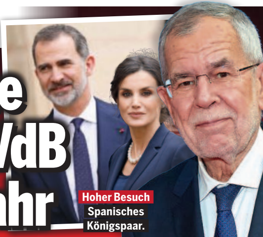
Hoher Besuch Spanisches Königspaar.