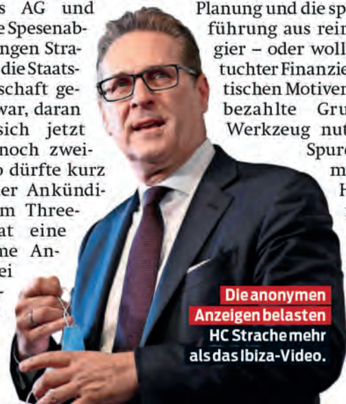
Die anonymen Anzeigen belasten HC Strache mehr als das Ibiza-Video.

Hintermännern zeigen sich jedenfalls immer deutlicher.